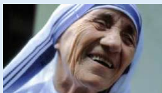
Mère Térésa, béatifiée par le Pape, Le 19 Octobre 2023, six ans après son décès