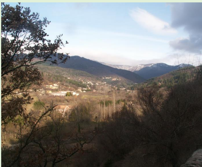
La Vallée du Coudoulous

D'autres récits, plus proches du pasteur Olivès, sont plus adaptés à parler de cette attaque d'Ardaillers ! Les SS y ont incendié trois maisons, tué un jeune homme et emmené six otages, (quatre seront pendus, deux jours plus tard, sur les arcades du viaduc de la gare de Nîmes). Il faut surtout noter l'état des routes de l'époque. Le tronçon de la départementale D190 de la mairie-école de la Matte en passant au milieu du village d'Arphy et arrivant au hameau de Bions n'avait été construit qu'en 1939. Et de plus la liaison avec la D48, qui elle avait été conçue fin 18 e siècle, ne sera réalisée que vers 1960. Et bien sûr tracée à l'économie en allongeant la jonction pour éviter de faire un pont qui était prévu pour passer la rivière du Coudoulous et en oubliant pour toujours de desservir le vieux mas de Grimal. La colonne SS, qui avait vadrouillé durant la nuit et le matin sur la D48 et la vallée du Coudoulous, sous une pluie battante et un épais brouillard n'occupa le village que dans l'après-midi bien entamée.