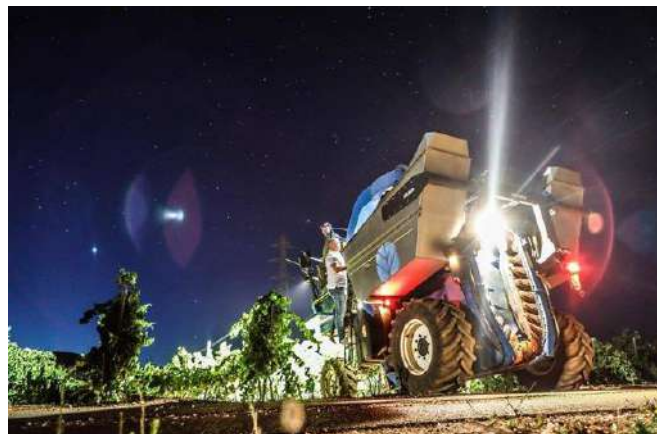
Vendanges de nuit à la machine