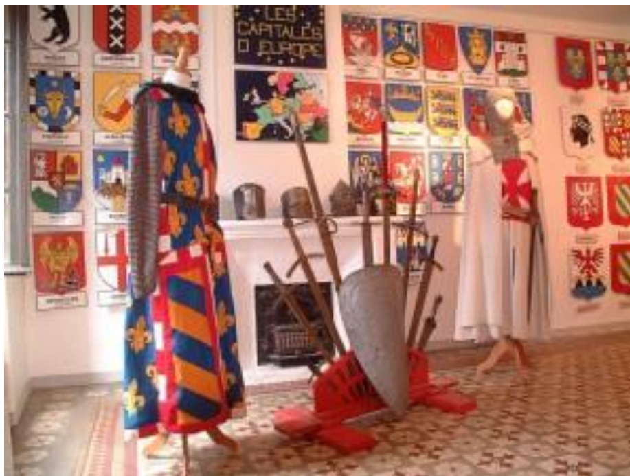
Le Musée du Blason

Rendez-vous le dimanche 26 Aout 2018 à Saint-Jean-du-Gard pour le 3 ème épisode des rencontres trimestrielles.