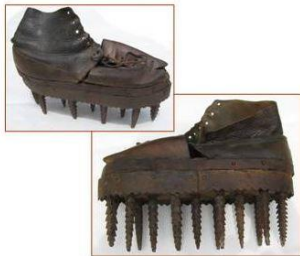
Chaussures à dépiquer -

Cleda : C'est une construction à un étage, la fumée passe à travers le plancher construit à clair voie pour sécher les châtaignes