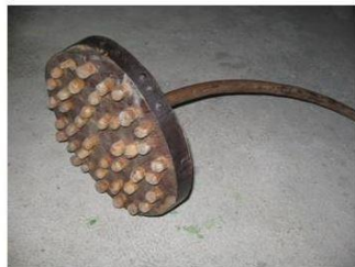
Dame à battre les châtaignes