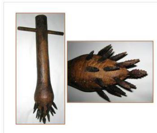
Pise à châtaignes